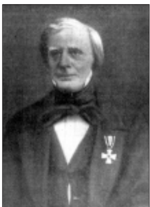
Abb. aus: Ernst Emmert (Hg.): Bilderatlas zur Geschichte der Taubstummenerziehung . Mit erläuterndem Text. München 1927, 76.