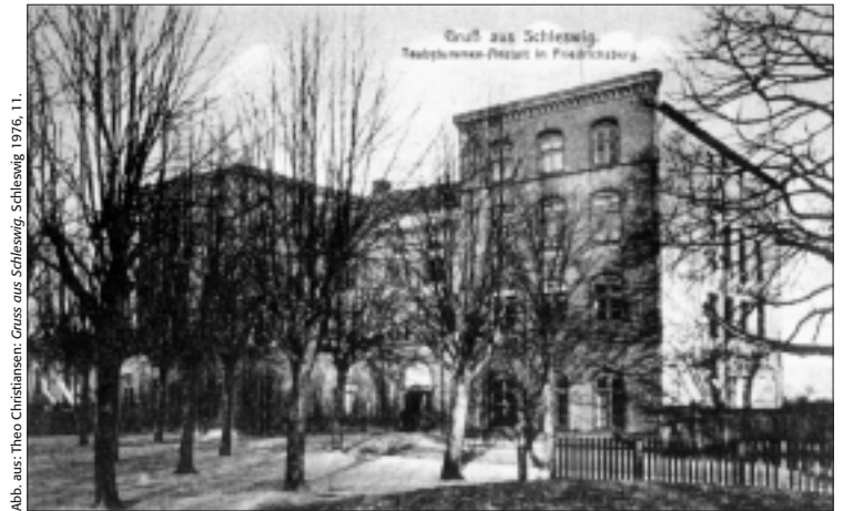
Abb. aus: Theo Christiansen: Grus aus Schleswig . Schleswig 1976, 11.

Alpha und Omega des elementaren Sprachunterrichts, es ist maßgebend für den ganzen ferneren Verlauf der Sprachbildung“ 55 . Somit sprach auch er sich für die Verbreitung der „rein-oralen Methode“ aus.