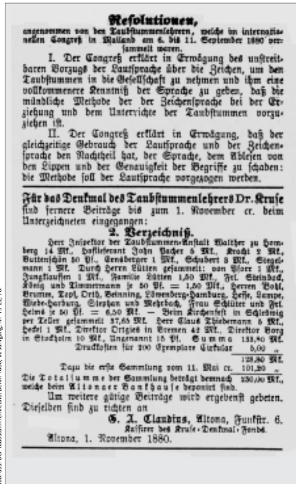
Abb. aus: Der Taubstummenfreund, Berlin 1880, IX. Jahrgang, Nr. 19–22, 70.

Die Resolution des Mailänder Kongresses ist über dem Spendenverzeichnis für Kruses Denkmal abgedruckt