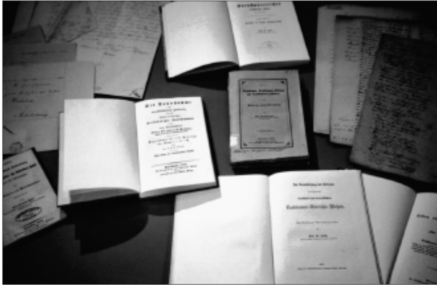
Dokumente, Briefe und Werke Kruses im Landesarchiv Schleswig-Hol- stein, Schleswig